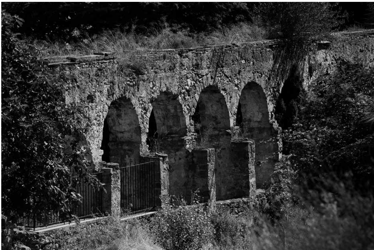
Vista parcial de l'aqüeducte de la Canaleta.

al Libro de la historia y milagros hechos a invocación de Nuestra Señora de Montserrat , publicat en successives edicions a partir del 1536. Al llarg d'aquesta centúria hi van funcionar quatre infermeries independents: la dels monjos i ermitans, ubicada a l'interior de la clausura; la dels frares donats, unida a finals de segle a la dels domèstics; la dels domèstics i pelegrins, anomenada també hospital, que el 1558 va ser reconstruïda per l'abat Benet de Tocco; i la dels malalts de pesta, situada al costat de l'ermita de Sant Iscle, abandonada el 1586. Al segle XVII, la Perla de Catalunya. Historia de Nuestra Señora de Montserrat (1677) de Gregorio de Argáiz esmenta l'existència d'una botica i un hospital al monestir i destaca que el metge cirurgià visitava gratuïtament els pelegrins malalts. A aquests edificis cal afegir l'hort del metge, on es devien conrear plantes medicinals, que fins a la primera del segle XX es trobava al darrere dels "aposentos de Sant Plà-