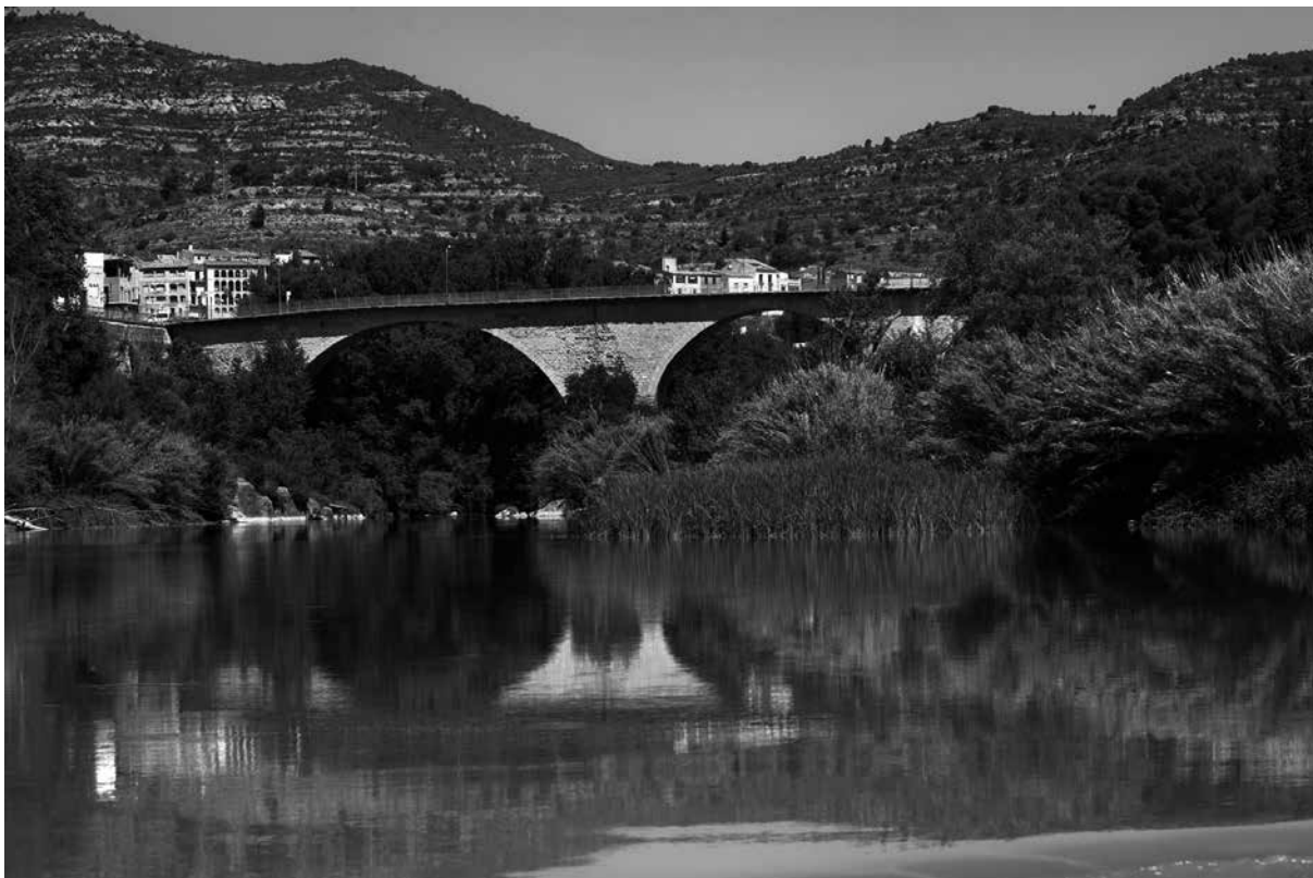
Vista del pont gòtic que travessa el riu Llobregat.

bosses: la primera –o major– i la segona, amb nou membres cadascuna; i la bossa tercera, que comptava amb dotze homes de consell. Aquesta estructura tripartida corresponia als estaments de la societat medieval; de fet, en cas d'una nova incorporació, només tenien el privilegi d'accedir directament a la primera o la segona bossa els artistes , com ara els metges, barbers, notaris i apotecaris.