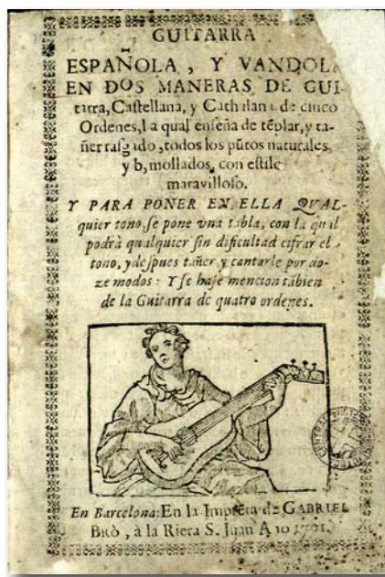
Portada del tractat de guitarra de Joan Carles i Amat, en una edició de 1701 de Gabriel Bro, conservat a la Biblioteca de Catalunya. Aquest tractat, reconegut com el primer d'Europa, va propiciar la popularitat de l'autor fora de les nostres fronteres.